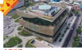
金石首獎 類 別：優良公共建設類 組 別：施工組 得獎機關：桃園市政府新建工程處 案 名：桃園市圖書館新館建築暨停車場興建工程