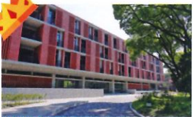
金石首獎 類 別：優良公共建設類 組 別：施工組 得獎機關：國立臺灣大學 案 名：國立臺灣大學人文館新建工程