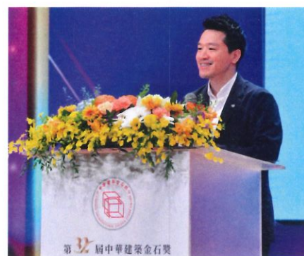
▲總統府副秘書長 何志偉致詞

中華建築金石獎依照優良建築施工品質、優良建築規劃設計、優良公共建設等得獎作品統計共計74件。特別值得一提的是，是與主題相符合、對於永續經營的高度踴躍，從基礎民生建設到地區未來開發，正反應出經濟逐漸甦醒的趨勢。以永續的品牌思維，為社會的發展奠定基礎，不論在消費面或是產業面，都能得到實質的提升。第32屆中華建築金石獎及2024城鄉永續發展獎得獎名單與相關活動訊息，請至金石獎活動網站 www.gstone.com.tw 或於臉書粉絲團搜尋「中華建築金石獎」加入粉絲，皆可不定期獲得金石獎消息最新動態。