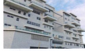
類 別：優良公共建設類 組 別：施工組 得獎機關：高雄市政府工務局新建工程處 案 名：高雄市政府警察局鳳山分局重建工程