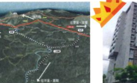
類 別：優良公共建設類 組 別：規畫組 得獎機關：臺北市觀光旅遊局 案 名：雙百年環線-猴硐、三貂嶺、牡丹文化敘事聚落設計畫、聚落營造工程