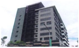
類 別：優良公共建設類 組 別：施工組 得獎機關：臺北市工務局新建工程處 案 名：臺北市北投區稻香合資大樓新建工程