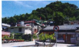
類 別：優良公共建設類 組 別：施工組 得獎機關：臺北市政府文化局 案 名：蟻蝶山與民新村文化景觀再利用工程