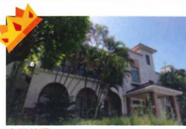
金石首獎 類 別：優良公共建設類 組 別：施工組 得獎機關：臺北市政府文化局 案 名：直轄市定古蹟臺北放送局修復工程