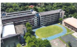
類 別：優良公共建設類 組 別：施工組 得獎機關：新北市政府水利局 案 名：新北市汐止區青山國民中小學透水保水工程