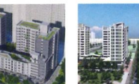
類 別：優良公共建設類 組 別：規畫組 得獎機關：臺中市政府住宅發展工程處 案 名：臺中市西屯區國安一期社會住宅