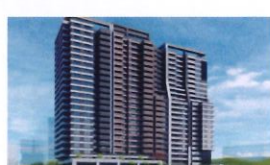
類 別：優良公共建設類 組 別：施工組 得獎機關：臺北市政府新建工程局 案 名：捷運萬大線中和高中站站週開發區6土地開發案