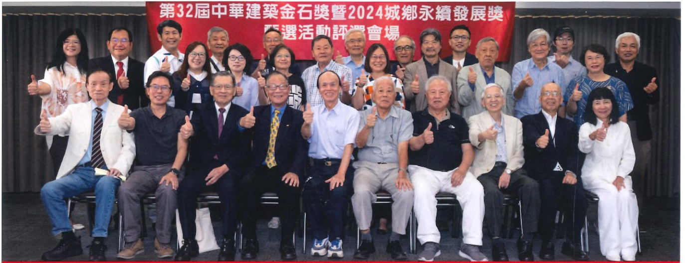
中華建築金石獎最專業最具權威的評審團隊合影