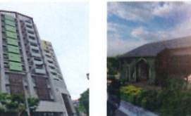
金石首獎 類 別：優良公共建設類 組 別：規畫組 得獎機關：新北市政府城鄉發展局 案 名：新北市中正橋派出所及青年社會住宅