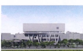
類 別：優良公共建設類 組 別：施工組 得獎機關：臺北市政府工務局新建工程處 案 名：臺北市文山區力行國民小學活動中心新建工程