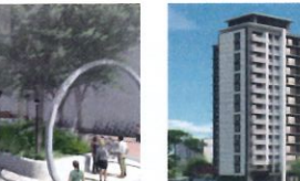
類 別：優良公共建設類 組 別：規畫組 得獎機關：臺北市工務局新建工程處 案 名：瑞公綠廊人行廊架改造工程