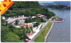
金石首獎 類 別：優良公共建設類 組 別：施工組 得獎機關：新北市政府高灘地工程管理處 案 名：淡水河五股蘆洲沿岸水環境整體改善計畫(第一期)