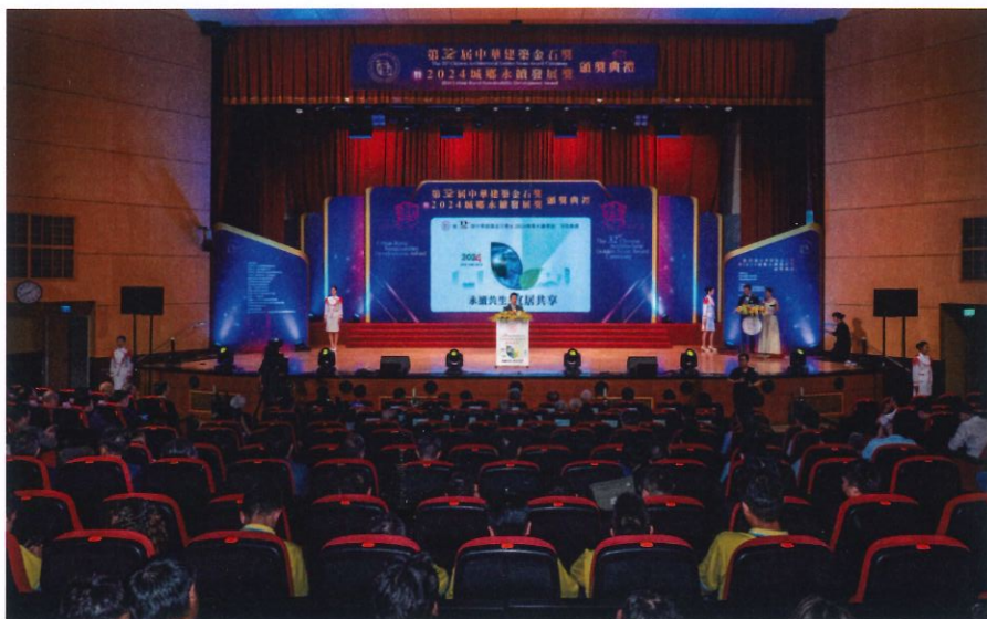
▲第32屆中華建築金石獎暨2024城鄉永續發展獎頒獎典禮現場

被譽為「建築界奧斯卡」的中華建築金石獎，至今已邁入第32屆，作為臺灣建築界歷史最悠久且最具指標性的專業獎項活動，於09月11日(三)晚間七時，假中油大樓國光會議廳舉行盛大的頒獎典禮。獲得金石獎的殊榮不僅是對優秀建築作品的肯定，更是推動臺灣社會環境持續進步的重要力量。金石獎由立法委員許智傑擔任主任委員，現場頒獎嘉賓冠蓋雲集，藉此為房地產界的全體同仁期許及勉勵，包括總統府何志偉副秘書長、行政院國家發展委員會主委劉鏡清及副主任委員彭立沛、行政院公共工程委員會李怡德副主任委員、交通部政務次長伍勝圓、內政部政務次長董建宏、內政部國土營建署徐燕興副署長等各級長官，皆出席恭賀並擔任頒獎貴賓，這不僅是對得獎者的肯定，也是對整個社會建設的鼓勵與支持。