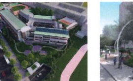
類 別：優良公共建設類 組 別：規畫組 得獎機關：臺北市工務局新建工程處 案 名：臺北市立和平高級中學教學大樓新建工程