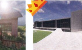
類 別：優良公共建設類 組 別：規畫組 得獎機關：新北市政府動物保護防疫處 案 名：新北市瑞芳動物之家建築物新建暨景觀設計工程