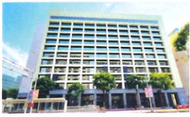
類 別：優良公共建設類 組 別：施工組 得獎機關：勞動部 案 名：志清大樓耐震補強工程