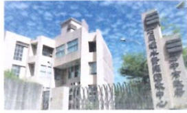
類 別：優良公共建設類 組 別：施工組 得獎機關：臺中市政府水利局 案 名：石岡壩水源特定區水資源回收中心