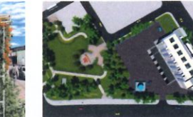
類 別：優良公共建設類 組 別：規畫組 得獎機關：新北市政府水利局 案 名：新北市蘆子坑寮坑溪南側低地排水設施新建工程