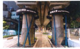
類 別：優良公共建設類 組 別：施工組 得獎機關：臺北市政府工務局公園路燈工程管理處 案 名：穿梭於山河之間的記憶 - 士林劍潭捷運綠廊