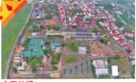
金石首獎 類 別：優良公共建設類 組 別：施工組 得獎機關：高雄市政府都市發展局 案 名：東北區之驛：旗山溪左岸旗尾地景暨工業地景改造工程