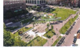
類 別：優良公共建設類 組 別：施工組 得獎機關：臺北市工務局公園路燈工程管理處 案 名：興國(中山46號)公園路燈工程