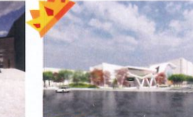
金石首獎 類 別：優良公共建設類 組 別：規畫組 得獎機關：桃園市政府新建工程處 案 名：桃園市中樞警察服務中心火化場暨停車場新建工程