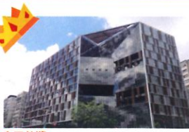
金石首獎 類 別：優良公共建設類 組 別：施工組 得獎機關：臺北市政府工務局新建工程處 案 名：南門大樓暨市場改建統包工程