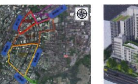
類 別：優良公共建設類 組 別：規畫組 得獎機關：臺中市政府水利局 案 名：臺中市潭頂區污水下水道系統第一期、主幹管工程類四標