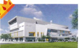
金石首獎 類 別：優良公共建設類 組 別：施工組 得獎機關：高雄市政府工務局新建工程處 案 名：高雄市小港區全民運動館興建工程(第二期)