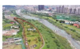
類 別：優良公共建設類 組 別：施工組 得獎機關：新北市政府高灘地工程管理處 案 名：新店溪溪州公園環境改造工程