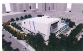
類 別：優良公共建設類 組 別：施工組 得獎機關：臺中市建設局 案 名：臺中市北屯國民運動中心興建統包工程