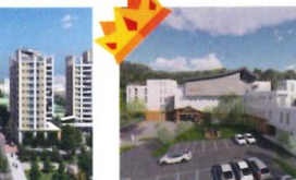
類 別：優良公共建設類 組 別：規畫組 得獎機關：高雄市政府工務局新建工程處 案 名：高雄市民國區大崗九村社會住宅新建統包工程