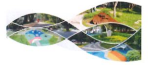
類 別：優良公共建設類 組 別：施工組 得獎機關：臺北市政府工務局公園路燈工程管理處 案 名：文化 - 豐年及同德公園景觀改善工程