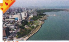
金石首獎 類 別：優良公共建設類 組 別：施工組 得獎機關：新北市政府高灘地工程管理處 案 名：八里左岸漫步廣場新建工程