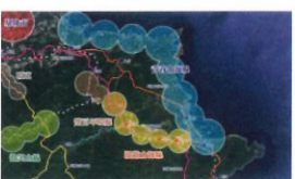
類 別：優良公共建設類 組 別：施工組 得獎機關：新北市政府觀光旅遊局 案 名：漫遊山海線-聚落、鐵道、自行車魅力輕旅廊道景觀工程