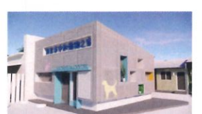
類 別：優良公共建設類 組 別：施工組 得獎機關：新北市政府動物保潔部及處 案 名：新北市中和動物之家空間優化改善工程