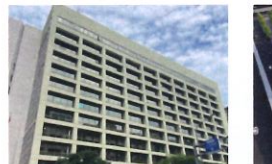
類 別：優良公共建設類 組 別：規畫組 得獎機關：勞動部 案 名：志清大樓耐震補強工程委託設計技術服務案