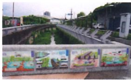
類 別：優良公共建設類 組 別：施工組 得獎機關：新北市政府水利局 案 名：藤寮坑溝排水水環境營造計畫(第二期)