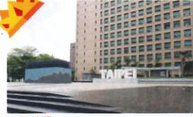
金石首獎 類 別：優良公共建設類 組 別：施工組 得獎機關：臺北市工務局公園路燈工程管理處 案 名：臺北市市政大樓及市府路周邊景觀改善工程