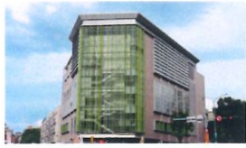
類 別：優良公共建設類 組 別：施工組 得獎機關：臺北市政府捷運工程局第二區工程處 案 名：臺北市南港區南港機廠基地社會住宅統包工程