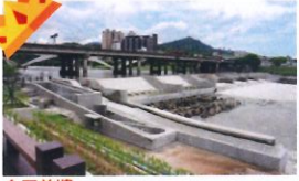
金石首獎 類 別：優良公共建設類 組 別：施工組 得獎機關：臺北市政府水利局 案 名：碧潭區改善暨周邊環境營造工程