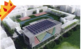
金石首獎 類 別：優良公共建設類 組 別：施工組 得獎機關：臺北市政府工務局新建工程處 案 名：臺北市松山區西松國民小學學生活動中心新建工程