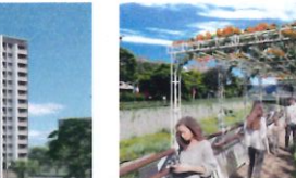
類 別：優良公共建設類 組 別：規畫組 得獎機關：北市政府捷運工程局 案 名：臺北市中山區中山段四小段580地號等8筆土地都市更新案