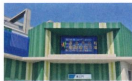
類 別：優良公共建設類 組 別：施工組 得獎機關：皇昌營造股份有限公司 案 名：代辦臺北市市場處所屬公有市場改建工程主體工程