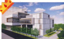
金石首獎 類 別：優良公共建設類 組 別：施工組 得獎機關：桃園市政府新建工程處 案 名：平鎮南勢綜合行政大樓新建工程