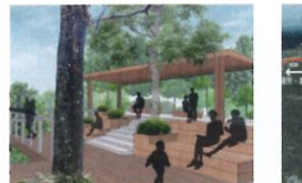
類 別：優良公共建設類 組 別：規畫組 得獎機關：新北市政府觀光旅遊局 案 名：新北市中和新莊區微笑山線環境營造工程