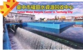
金石首獎 類 別：優良公共建設類 組 別：施工組 得獎機關：臺中市水利局 案 名：福田水資源回收中心