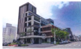
類 別：優良公共建設類 組 別：施工組 得獎機關：桃園市政府新建工程處 案 名：桃園市觀音區多功能場館統包工程