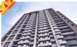
金石首獎 類 別：優良公共建設類 組 別：施工組 得獎機關：皇昌營造股份有限公司 案 名：中和安邦段青年社會住宅新建統包工程