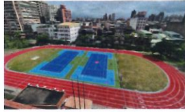
類 別：優良公共建設類 組 別：施工組 得獎機關：臺北市政府水利局 案 名：新北市三重區正義國小透水保水工程