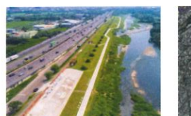
類 別：優良公共建設類 組 別：規畫組 得獎機關：臺中市政府水利局 案 名：筏子溪門戶迎賓水岸直道下游串連工程