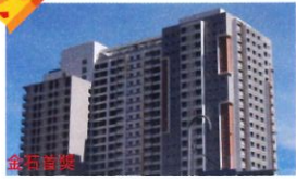
金石首獎 類 別：優良公共建設類 組 別：施工組 得獎機關：臺北市政府都市發展局 案 名：臺北市南港區南港機廠基地社會住宅統包工程