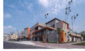
類 別：優良公共建設類 組 別：施工組 得獎機關：高雄市政府工務局新建工程處 案 名：鳳山日照社福多功能中心興建工程