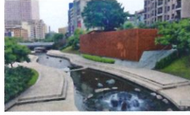
類 別：優良公共建設類 組 別：施工組 得獎機關：臺中市政府水利局 案 名：臺中市柳川中華水質淨化攔壩水環境維護管理(崇德橋南至南屯側溝段)