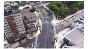
類 別：優良公共建設類 組 別：施工組 得獎機關：高雄市政府工務局道路維護工程處 案 名：三民區正義路(九如一路至建國一路)人行聽覺改善工程(第一標)