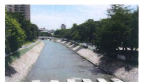
類 別：優良公共建設類 組 別：施工組 得獎機關：臺中市水利局 案 名：臺中市軟籽椰子溪水環境改善工程