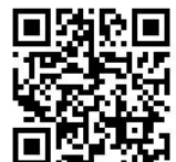
桃園市國民小學藝術才能音樂班 鑑定線上報名系統

1、申請方式及時間：採線上申請成績複查，115 年 5 月 4 日(星期一)00:00 至 5 月 5 日(星期二)中午 12:00 前至桃園市國民小學藝術才能音樂班鑑定招生線上報名系統( https://tyc.sfes.tyc.edu.tw/elmmusic/ )申請複查(如附件七)，逾時不予受理。