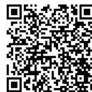
桃園市國民小學藝術才能音樂班 鑑定線上報名系統

三、承辦學校大成國小網頁( https://www.dches.tyc.edu.tw/ )